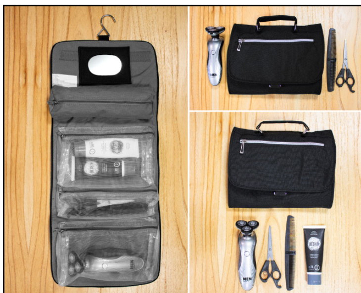
T340 - Necessaire "Daily"

A todos nos agrada recibir como obsequio un producto para mimarnos o para cuidar nuestro cuerpo. Las empresas ya lo saben, es por ello, que es común ver en campañas de publicidad o lanzamientos de productos, que se obsequie como promocional un set con productos de cuidado personal, un necesaire o productos de belleza.